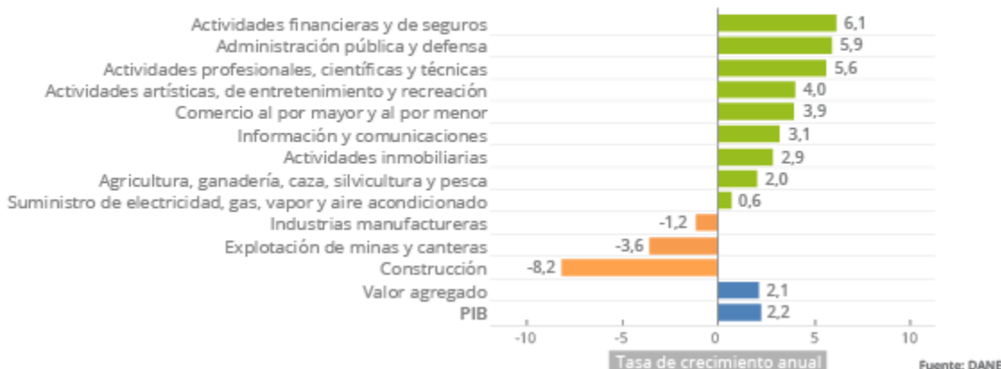
PIB - Producto Interno Bruto - 2018 Pr - Primer trimestre Tasa de crecimiento anual por actividad económica

1. Clasifica cada una de las actividades económicas representadas en la gráfica anterior en el sector correspondiente: